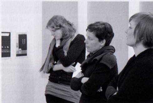
Beate Gütschow (Bildmitte) mit Hildesheimer Studenten im Berliner Atelier.

Noch bis zum 24.05.2010 ist Beate Gütschow an der Ausstellung „Realismus – Das Abenteuer der Wirklichkeit“ in der Kunsthalle Emden und an der Ausstellung „Berlin Transfer“ in der Berlinischen Galerie beteiligt. In der Galerie Rudolfinum in Prag werden ihre Landschaftsbilder vom 22. April bis zum 4. Juli 2010 zu sehen sein. Anlässlich ihrer Einzelausstellung in der Kunsthalle im Lipsiusbau in Dresden ist 2009 unter dem Titel „Beate Gütschow: S“ ein großformatiger Katalog bei Hatje Cantz erschienen.