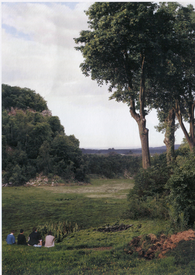
LS#7, 1999, C-print, 164 x 116 cm. Aus der aktuellen Ausstellung in der Galerie Rudolfinum in Prag.