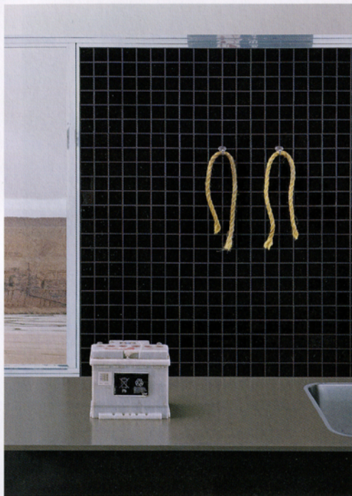
#1, 2009, Light box, 91 x 66 cm, Courtesy: Barbara Gross Galerie, München; Produzentengalerie, Hamburg; Sonnabend Gallery, New York. © Beate Gütschow / VG Bild-Kunst, Bonn. Ausstellung Produzentengalerie Hamburg.

Papier arrangiert. Ein zentrales Ausgangsbild gibt es nicht. „Ich konstruiere einen neuen Raum“, sagt Beate Gütschow, „entferne aber keine Details“. Anders als viele zeitgenössische Künstler, die ihre Bilder am Computer bearbeiten, verzichtet sie darauf, das fotografische Material von jeglichem Makel zu befreien. Wenn sie die Fragmente in die grafische Umgebung des Bildbearbeitungsprogramms einspeist, bleiben die zufällig mitfotografierten Störungen erhalten. Beate Gütschow unterwirft sich der Widerständigkeit des fotografischen Ausgangsmaterials. Sie entfernt weder herumliegenden Unrat noch die Zeichen des Zerfalls. Bei der Bearbeitung setzt sie ausschließlich solche Werkzeuge ein, die den Möglichkeiten des traditionellen Fotolabors nachgebildet sind. Auch das fotografische Korn ist in den Stadtlandschaften deutlich zu erkennen. Es reibt an der glatten Oberfläche der Computerbilder und rettet so das physikalisch-chemische Abbildungsverfahren der Fotografie ins digitale Zeitalter hinein. Das fotografische Korn, das einst die Fotografie in ihrem Inneren bestimmte, tritt als Zeichen an die Oberfläche und versorgt das Bild mit Authentizität. Das unbehandelte Ausgangsmaterial durchsengt die Tafelbilder mit jenem berühmten Fünkchen Zufall, das ihnen die Anmutung unmittelbarer Realität verleiht.